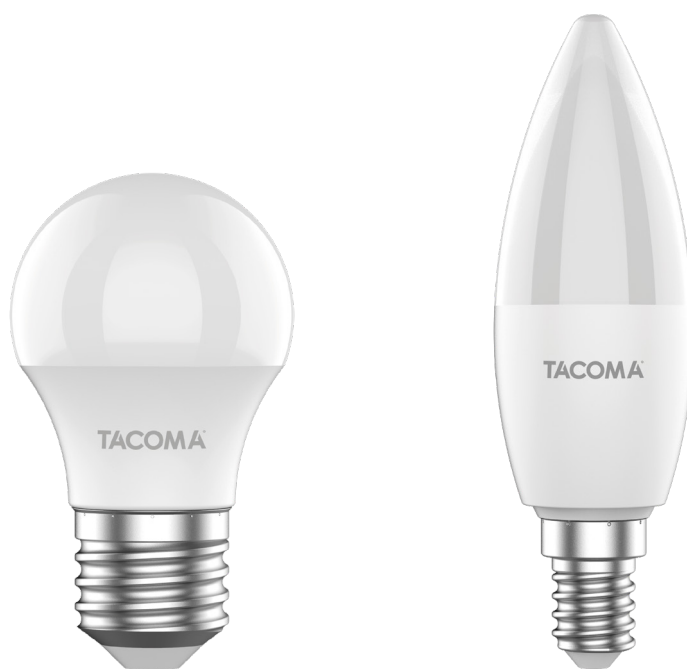
5W - 7W